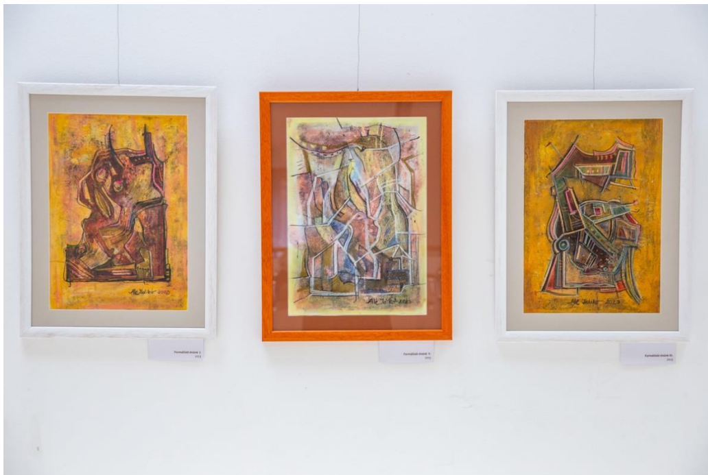
Formálódó énünk I., V., III., 2023