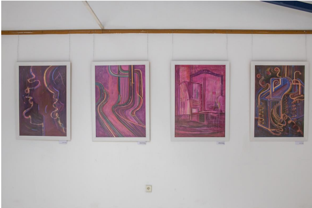
Muzsika Chopintól II.-I., 2022 (képszéleken) Kép Blaho Attila Absztrakt V., I. elektronikus szerzeményéhez, 2018