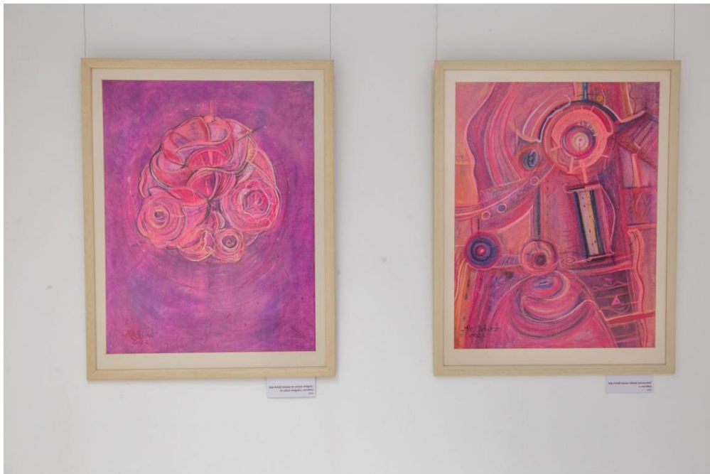
Kép Petőfi Sándor Az utolsó virágok c. verséhez, 2022 Kép Petőfi Sándor Minek nevezzelek? c. verséhez, 2022