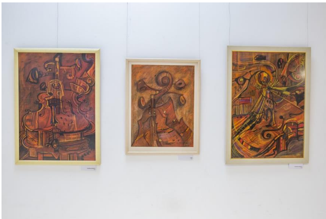
Gordonka–variációk IV., 2002