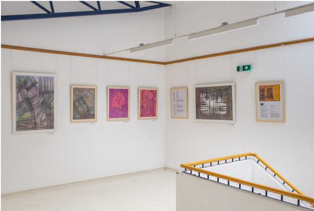
Tárlat-enteriőr részlet Irodalmi ihletésű művek